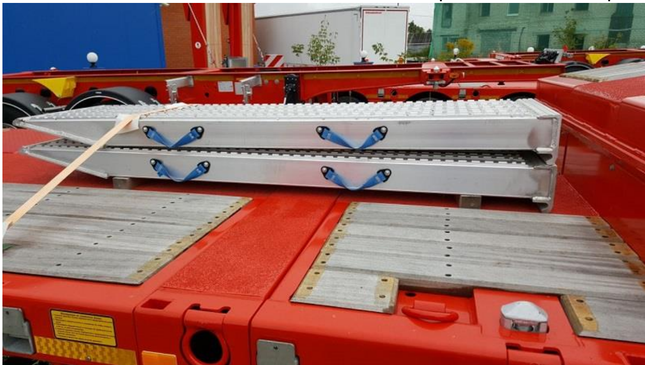
Фото приставных алюминиевых трапов

Внимание: В спецификации указаны стандартные параметры.